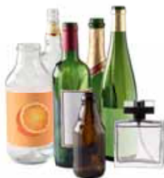
◆ BOUTEILLES EN VERRE FLACONS DE PARFUM