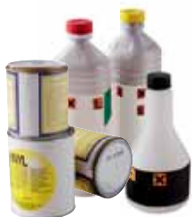
● PRODUITS TOXIQUES ET PEINTURE