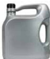
● HUILES DE VIDANGE