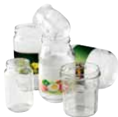
◆ POTS ET BOCAUX EN VERRE