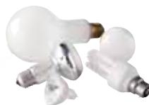
● LAMPES (Les ampoules à filament peuvent être jetées avec les ordures ménagères)