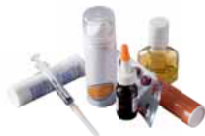
● MÉDICAMENTS ET DÉCHETS DE SOINS À RISQUES INFECTIEUX

Dans une déchèterie et/ou dans les bornes spécifiques : magasins pour les piles et ampoules, pharmacie pour les médicaments et déchets de soins à risques infectieux.