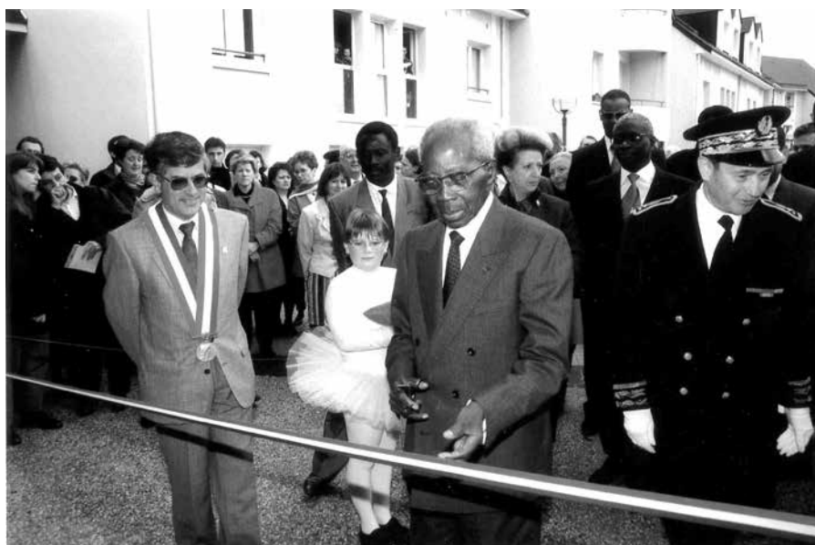
18 mars 1995 : inauguration de l'Espace Senghor

En 1993, il pose la première pierre de l'Espace Senghor, qu'il inaugure en mars 1995 . Il y prononce un discours militant : "Il vous appartient, à vous les jeunes, d'élaborer cette Civilisation de l'Universel, qui sera faite des valeurs