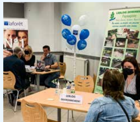
Le 1 er forum de l'emploi de l'UCIA de l'Odon a accueilli plus de 50 personnes, une belle initiative qui a permis de pourvoir 4 postes.