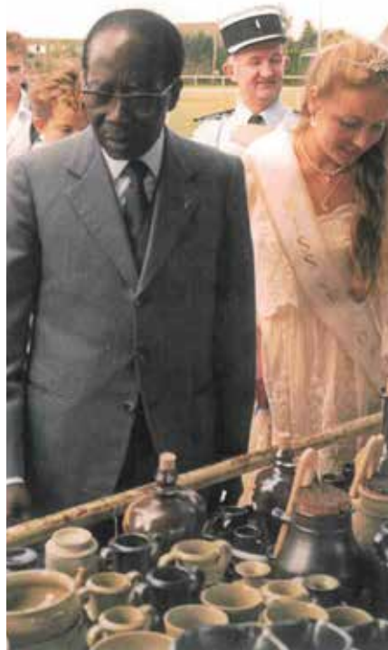
Fête de la St Germain avec Miss Verson

complémentaires de tous les continents et de tous les peuples. Gardez à l'esprit qu'il n'y a pas de civilisation sans culture car l'effort culturel est lui-même la principale valeur de la civilisation."