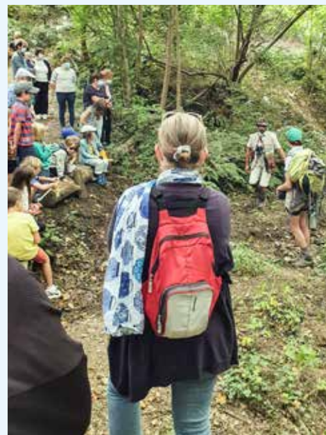
Un succès pour la drôle de balade avec la compagnie Mycélium tout comme pour l'exposition « Dans les bras de l'Odon » de Jean-Marie Hamel, un talent versonnais.