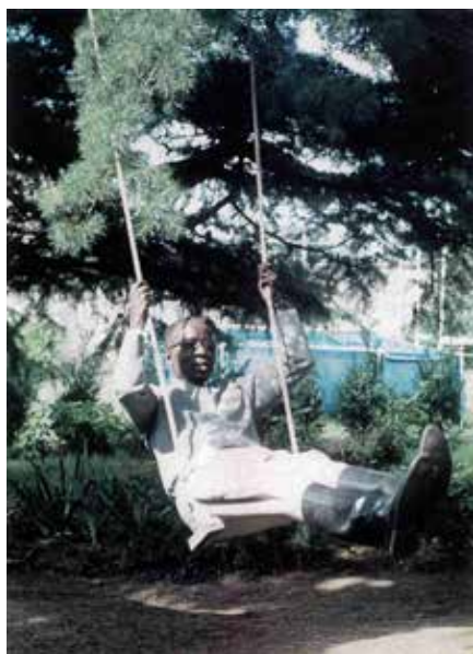
En vacances à Verson

Il y a 20 ans, le 20 décembre 2001 , Léopold Sédar Senghor s'éteignait dans la grande maison aux volets blancs de la rue du général Leclerc.