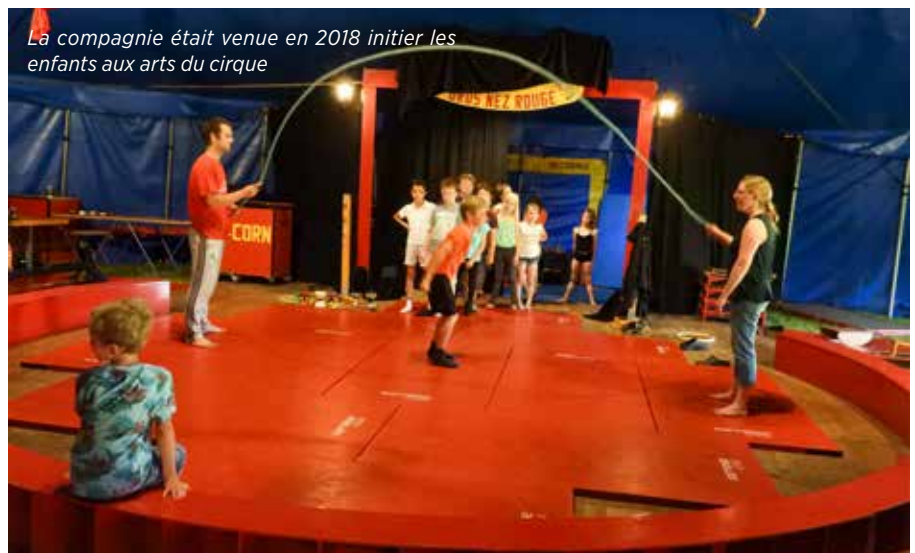
La compagnie était venue en 2018 initier les enfants aux arts du cirque

la forêt de Grimbosq, le château de Falaise, le cinéma Lux (dans le cadre du projet « Ecole et cinéma »), le Mémorial de Caen. Et gageons, qu'au fil de l'année, l'équipe enseignante aura encore d'autres idées.