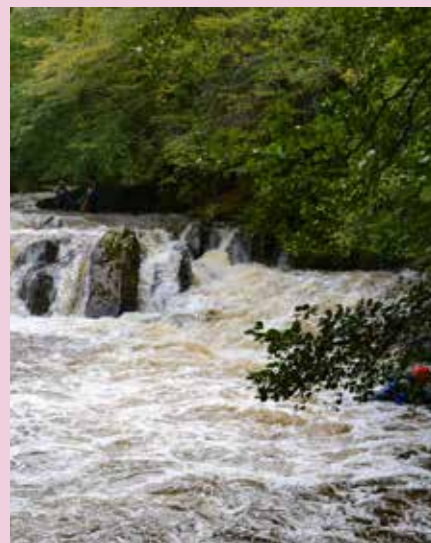
Kayak en eaux vives sur la Cure et le Chalaux dans le Morvan

Nous espérons tous une année sans coupure et pleine de bons moments.