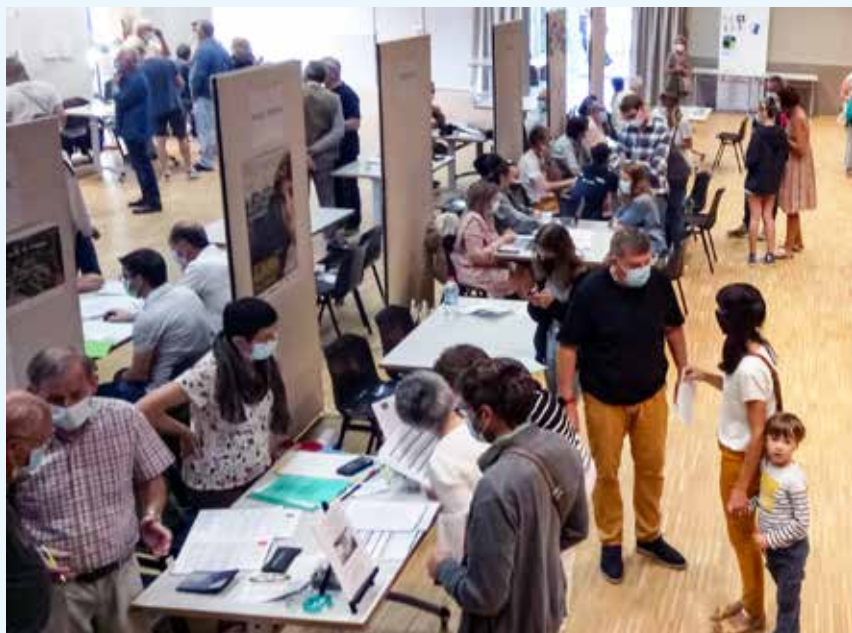
Le Forum des associations a accueilli plus de 600 personnes le 4 septembre dernier à la salle des Trois Ormes.