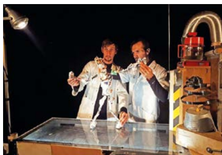
le spectacle Bibliotron programmé à l@ bibliothèque pour les enfants des écoles

Les élèves des CM2 de Mme Grandjean et de Mme Fileux ont vu le spectacle Bibliotron (théâtre jeune public à partir